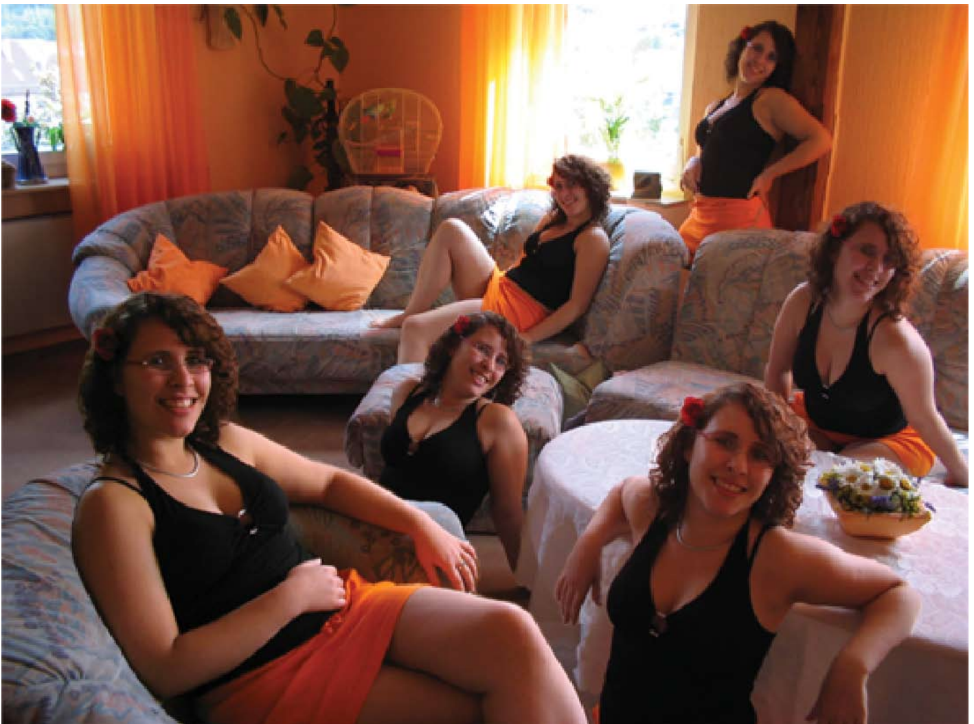
Abbildung 01: Standardmäßig platzierte PSD-Datei mit allen Ebenen